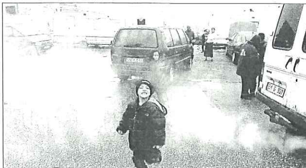
■ Les Roumains ont trouvé refuge sur un parking poids lourds de Laneuveville.