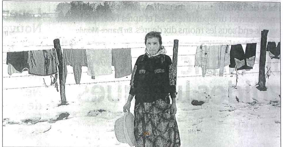
■ Après la pluie, la neige s'est invitée sur le campement qui a finalement été évacué une nouvelle fois.

Reste qu'entre-temps, Dame météo a de nouveau fait des siennes et une vague de froid s'est installée, accompagnée d'importants épisodes neigeux. Autour du camp, l'eau réinvestissait lentement et inexorablement les lieux. Et si une partie des caravanes brinquebalantes a été reprise par leurs propriétaires, nombreuses sont