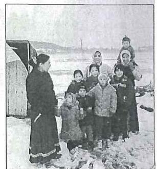
■ Les enfants gardent le sourire.